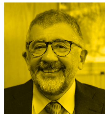
Mario Cimoli Secretario Ejecutivo Adjunto de la Comisión Económica para América Latina y el Caribe (CEPAL).

Por eso es crucial discutir cómo avanzar en la consecución de un mercado digital regional y el papel de América Latina y el Caribe. En términos concretos, esta idea ya ha comenzado a materializarse en varios esfuerzos desarrollados por bloques regionales, como la Alianza del Pacífico (AP), el Mercado Común del Sur (Mercosur), el Mercado Común Centroamericano (MCCA) y la Comunidad del Caribe (Caricom). Este tipo de estrategia tiene el potencial de generar un impacto económico significativo con varios efectos directos e indirectos. Esto se ha visto en Europa, donde la creación de un mercado único digital mostró un mejor nivel de digitalización en los países que conforman el bloque. Por ejemplo, según algunas estimaciones que hemos realizado, la creación de una estrategia de mercado digital regional en la AP puede aumentar el impacto de la digitalización en relación con el Producto Interior Bruto (PIB) de 9.620 a 13.886 millones de dólares anuales. Por lo tanto, debido a los efectos únicos de un mercado digital regional, en un período de cinco años el PIB podría incrementarse en más de 21.330 millones de dólares, sin mencionar los efectos de derrame y de cadena que podrían generarse tanto dentro de los países como en el propio bloque.