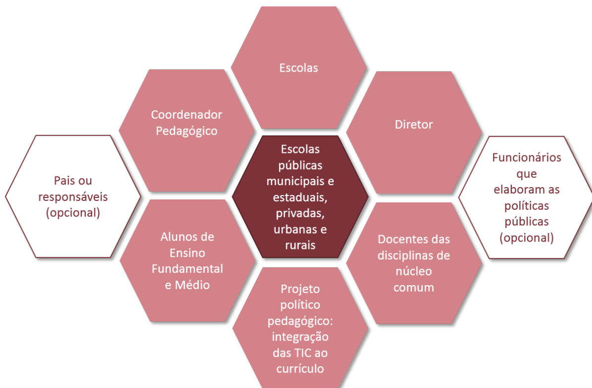
Figura 2. Unidades de análise